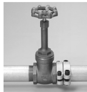
鋼管マルチ継手型